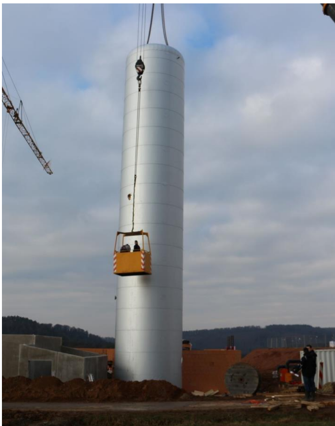
Der Speicher wurde mit zwei Kränen aufgerichtet, auf der Bodenplatte verankert und zuletzt an den Transportlöchern verschlossen. Er ist 20 cm stark gedämmt.

Die Bauarbeiten Pizzegärten/ Ellerweg sollen heute (21.3.2025) abgeschlossen sein. Daher beginnen jetzt die Arbeiten im Wolfsgarten, wo die Trasse am nördlichsten Ende beginnend über Im Wolfsgarten und Am roten Wasser nach unten geführt wird.